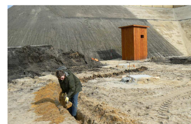
ca. 1800m Kabelgräben