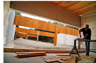
Elt,- Installation 100m Schießstand